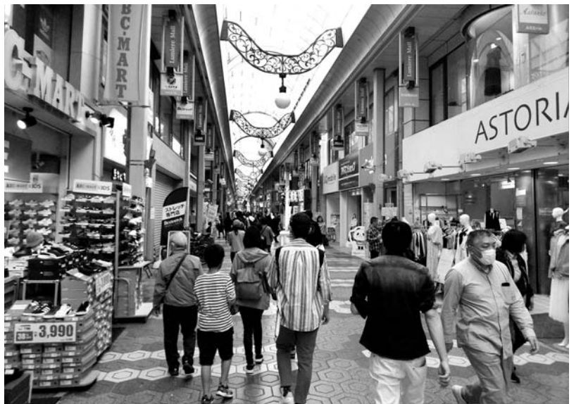
自分が見たままの状態を相手に伝えるには、自分の見ている状態と同じ絵が相手の頭に浮かぶように表現する

最初に述語の部分から考えていこう。「混雑している」は、何かの動きを表しているのだから、それをはっきりさせる。人なのか、それとも車なのか、それとも、人と車が混在しているのか。例えば、混雑しているのは人だとすると、